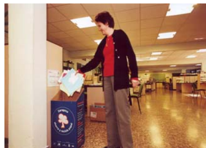
Sistema de recogida selectiva interna en Lackey S.A., empresa “amiga de los árboles”.