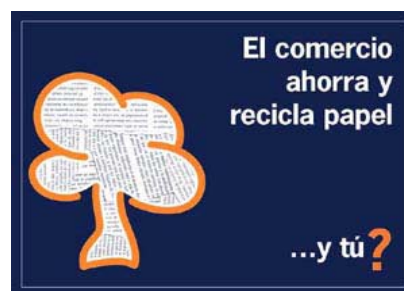
Motivo de la campaña de sensibilización dirigida a los comercios.

Los establecimientos comerciales son grandes generadores de residuos de papel y cartón. Se estima que sólo en Zaragoza producen 24.000 toneladas de estos residuos, pero sólo se recupera una mínima parte a través de los sistemas de recogida selectiva. La colaboración de los comerciantes en el proyecto ha sido clave para cambiar esta situación por lo que hemos desarrollado diversas actividades de formación y sensibilización: