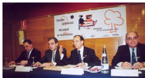
Seminario sobre la gestión del papel en oficinas organizado en la sede de la Confederación de Empresarios de Aragón, noviembre de 2001.