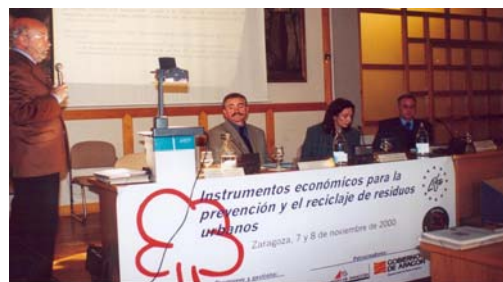
Presentación de los expertos en las jornadas sobre instrumentos económicos para la prevención y el reciclaje de los residuos urbanos, noviembre 2000.