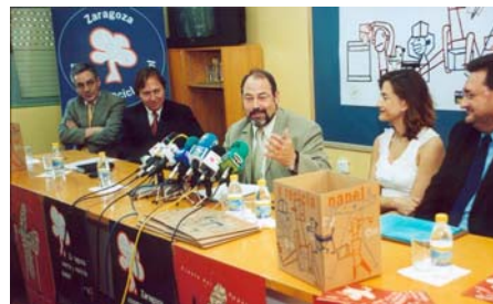
Rueda de prensa celebrada en el C.P. Eliseo Godoy Beltrán para presentar la papelería domiciliaria, 4 de junio de 2001.