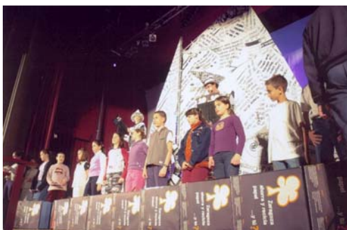
Presentación de las actividades escolares por alumnos del C. Sta. Magdalena Sofia, acto de cierre.

La concienciación de los niños y niñas en la reducción, la reutilización y el reciclaje del papel es una inversión de futuro. Los centros escolares son fundamentales para la transmisión y el aprendizaje de nuevas conductas más respetuosas con el medio ambiente. Por este motivo, hemos puesto en marcha medidas para incrementar el reciclaje en los centros escolares, fomentar el uso de papel reciclado y promover la reducción en el consumo de papel: