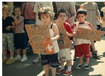
Distribución de la papelería en un centro escolar.

Reducir y reciclar es cosa de todos. Los ciudadanos se convierten en uno de los factores clave para consolidar la recogida selectiva. La separación en origen de los residuos y su posterior depósito en los contenedores azules requieren necesariamente la participación de los ciudadanos. Por este motivo hemos incidido en la formación y la sensibilización de toda la comunidad local: