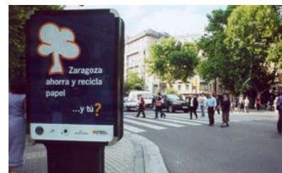
Campaña de sensibilización, mobiliario urbano.